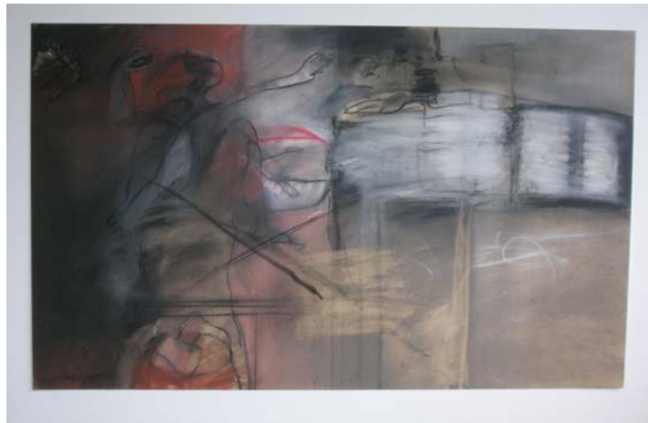
Innerlijk beeld - krijttekening 78 x 56 cm. / Michiel Czn. Dhont

3 Workshops op zat. 10 maart - zat. 17 maart - zat. 24 maart 2018